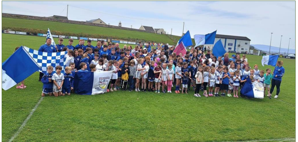
Lucht tacaíochta Chillian ar Pháirc na mBreathnach roimh Chraobh na hÉireann

Níl aon easpa ceoil ná amhráin ar na baill ach oiread agus beidh neart siamsaíochta ann freisin. Beidh míle fáilte roimh bhaill uilig an chumainn a bheith i láthair nó déanaigí cinnte éisteacht le Iris Aniar ar RTÉ Raidió na Gaeltachta maidin amárach ag 9.15.